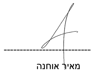
מאיר אוחנה גזבר המועצה